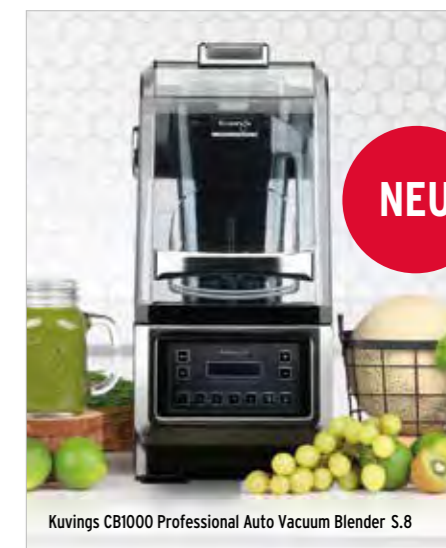
Kuvings CB1000 Professional Auto Vacuum Blender S.8