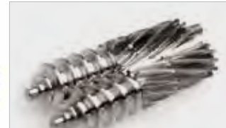
Tribest Greenstar Pro und GS 5: Doppelpresswalzen aus 100% Edelstahl.