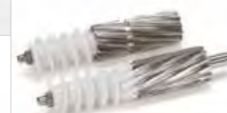
Tribest Greenstar Elite: Doppelpresswalzen aus Edelstahl und Kunststoff